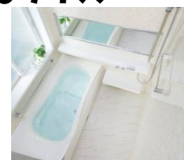
ハウステック フェリテC