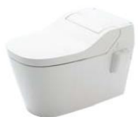
パナソニックアラウーノS